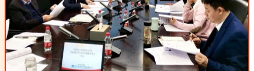
11月22日,中建设计研究院党委理论中心组集中学习全会精神。