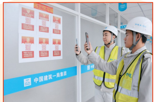
中建一局建设发展公司项目将全会精神要点制成二维码上墙,员工可随时扫码学习。