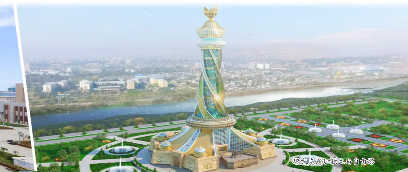
塔吉克斯坦独立与自由塔