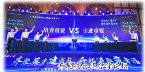
开展校企合作论坛

注重文化引领，塑形铸魂助发展。提炼出以“开拓进取，革故鼎新”为核心的“开拓文化”，提振员工改革发展的信心和干事创业的精气神；用好红色资源，建成“建工筑业”文化馆，入选国务院国资委“中央企业红色资源网络展览”。