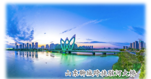
山东聊城跨越骇河大桥

化和产业化路径，在深基坑、大跨度、超高层等10多个领域拥有世界领先的综合建造技术。截至目前，中建八局共获国家科技进步奖一等奖5项、省部级科技奖1218项、发明专利授权1174项，企业科技竞争力优势进一步凸显。