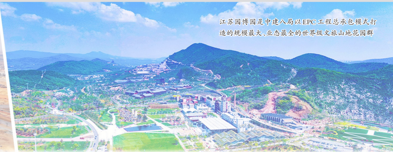
江苏园博园是中建八局以EPC工程总承包模式打造的规模最大、业态最全的世界级文旅山地花园群