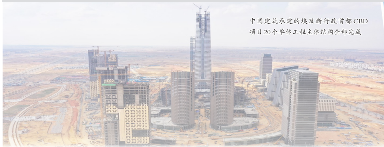
中国建筑承建的埃及新行政首都CBD项目20个单体工程主体结构全部完成