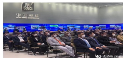
外国驻华使节、国际组织驻华代表在中国建筑集团交流座谈。

人民网北京9月22日电(记者韩颖、原晓军)21日,驻华使节“步入中国建筑”活动在北京举行。76位外国驻华使节、国际组织驻华代表来到中国建筑集团参观并交流座谈。