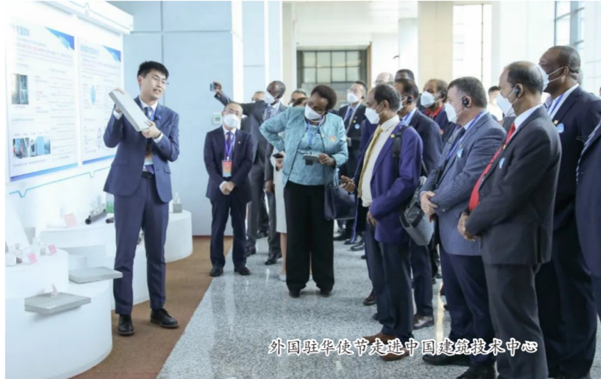
外国驻华使节走进中国建筑技术中心

中新网北京9月21日电(记者 邢翀)建筑业是国民经济的重要组成部分,中国建造持续改变着中国面貌。21日,76名驻华外交官、国际组织驻华代表走入中国建筑集团,实地感知中国建筑别样之美。