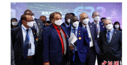
外国驻华使节参观中国建筑“中国建造之路”展厅。

【侨报网】建筑业是国民经济的重要组成部分,中国建造持续改变着中国面貌。21日,76名驻华外交官、国际组织驻华代表走入中国建筑集团,实地感知中国建筑之美。