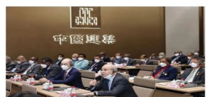
9月21日,外国驻华使节走进中建,参加座谈。

中国日报北京9月22日电(记者冯永斌)2022年9月21日,76名驻华外交官、国际组织驻华代表走入中国建筑集团,实地感知中国建筑别样之美。