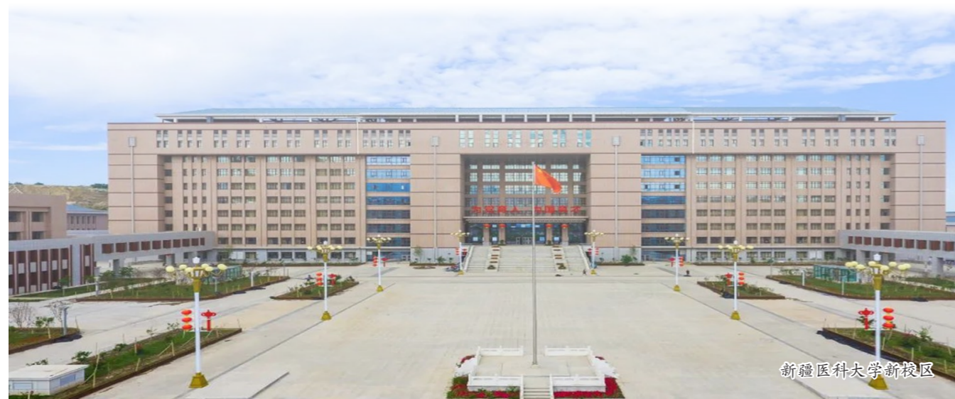
新疆医科大学新校区

艰难困苦，玉汝于成。中建新疆建工将以改革者的勇气、创新者的魄力、奋斗者的姿态，立足新发展阶段、贯彻新发展理念、构建新发展格局，强化党建引领，凝聚磅礴力量，奋力书写中建新疆建工高质量发展新篇章，以优异成绩迎接党的二十大胜利召开。