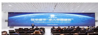
21日,驻华使节“步入中国建筑”活动在北京举行。

【欧洲时报网】建筑业是国民经济的重要组成部分,中国建造持续改变着中国面貌。9月21日,驻华使节“步入中国建筑”活动在北京举行。76名驻华外交官、国际组织驻华代表走入中国建筑集团,实地感知中国建筑之美。