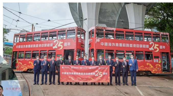
在运营百年的香港有轨电车投庆回归广告