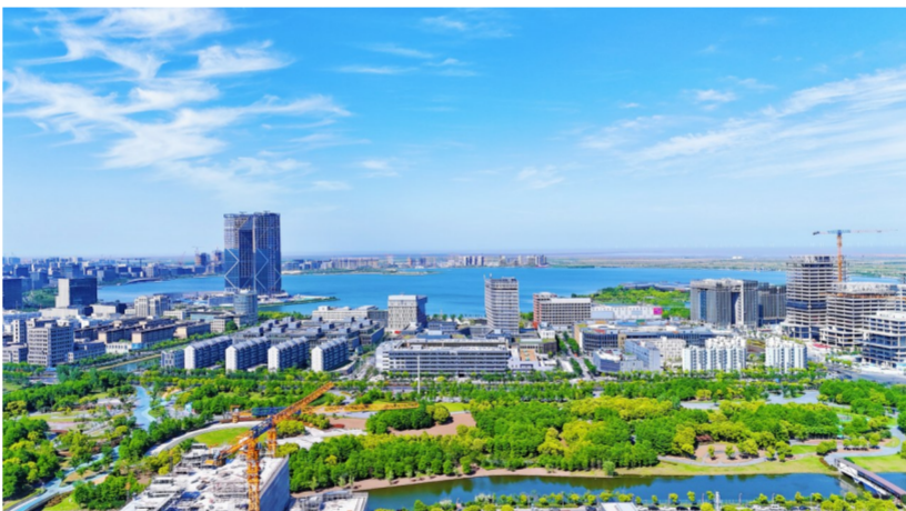
中建八局承建的上海港城广场四期工程交付，至此，上海临港主城区最大规模的城市综合体全面竣工。项目总建筑面积约55.8万平方米，2015年开工，共分四期开发建设。（冉一帆）