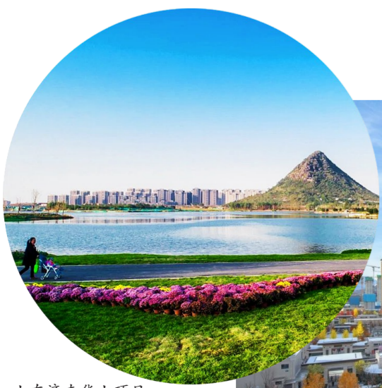
山东济南华山项目