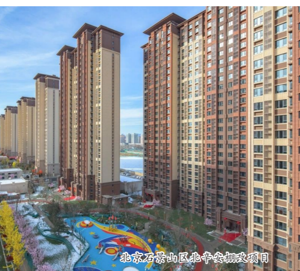
北京石景山区北辛安棚改造项目