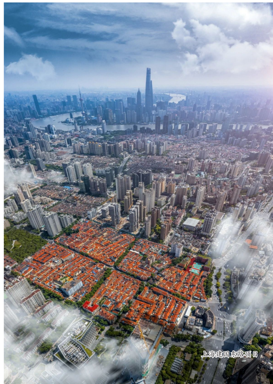
上海建国东路项目

1979年6月，中海集团承担着“为国创汇”的使命在香港成立。45年来，中海集团以100万港元起步，从劳务分包做起，积极参与市场化竞争，坚持自力更生、艰苦奋斗，总资产超过1.2万亿港元，实现国有资产增值，书写创业兴业和爱国爱港新篇章。中海集团旗下拥有中国海外发展有限公司（股票代码：00688.HK）、中国建筑国际集团有限公司（股票代码：03311.HK）、中海物业集团有限公司（股票代码：02669.HK）、中国海外宏洋集团有限公司（股票代码：00081.HK）和中国建筑兴业集团有限公司（股票代码：00830.HK）5家上市公司，打造了集投资、设计、建造、运营和服务于一体的全产业链业务模式。2023年，中海集团实现合约额5637亿港元、营业收入3533亿港元，财务状况保持稳健，利润指标处于行业领先水平。