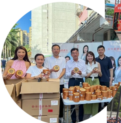
中国海外爱心基金会与非牟利机构“心中有晴”合作，举办“中秋同乐 送暖到社区”活动

深入开展社区服务。开展“中海服务进社区”系列活动，深入香港深水埗区、荃湾区及观塘区基层社区，组织“端阳敬老”“中秋同乐”活动，向8000余名居民派发爱心粽子、月饼及食品包，送去节日问候。