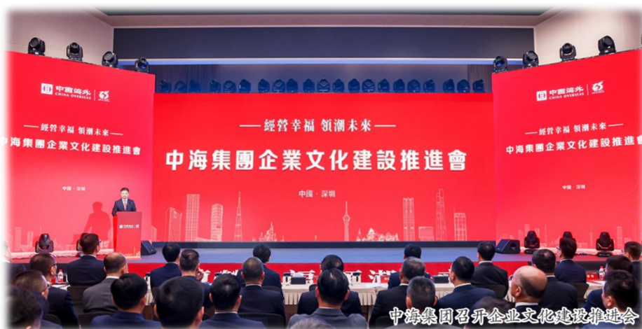
中海集团召开企业文化建设推进会