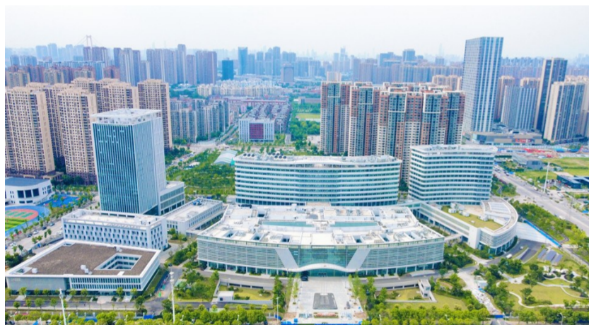
中建三局承建的武汉大学人民医院洪山院区通过竣工验收。项目总建筑面积27.7万平方米，是涵盖医疗、科研、教学、预防保健、重大疫情救治等功能为一体的大型综合性三甲医院。（谢杰夫、王腾）

中建科工承建的昌平生命谷国际医药智造园（一期）项目开工。项目位于北京市昌平区，总建筑面积3.98万平方米，建成后，将用于治疗类器械、诊断类器械、植入类器械等产品的研发和生产，助力北京绿色医药健康产业布局。（赵梓棠）