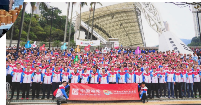
中海集团20多年来参加香港、澳门“公益金”活动