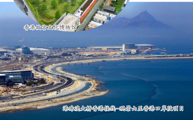
港珠澳大桥香港接线—观景山至香港口岸段项目