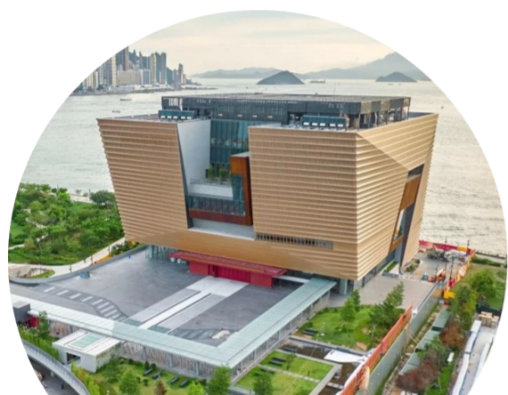
香港故宫文化博物馆